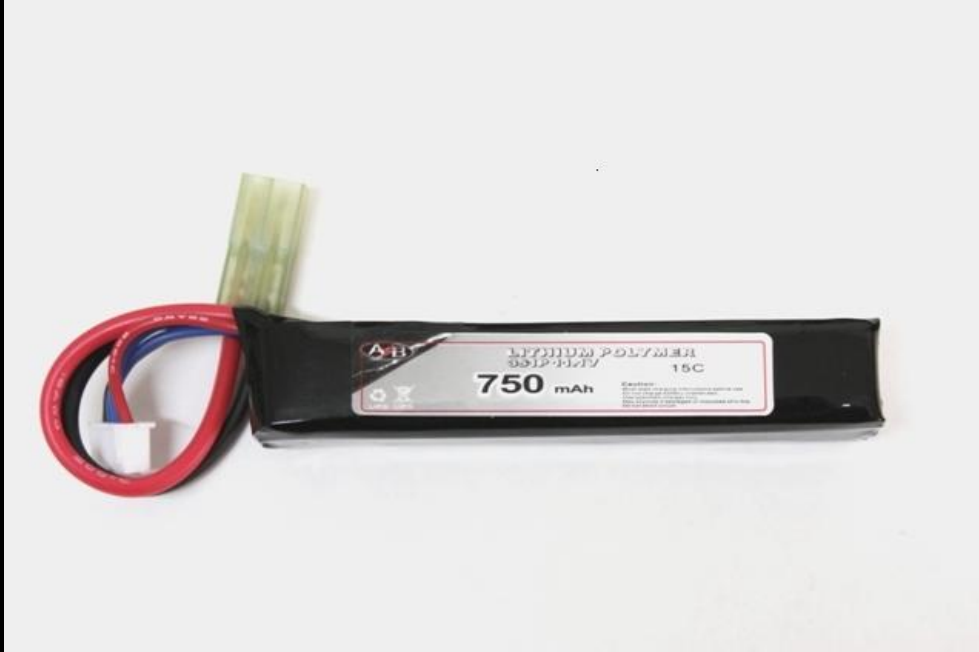
2)LI-PO 750Mha da 7,4V - 15C Dimensioni 92mm x 18mm x 13mm